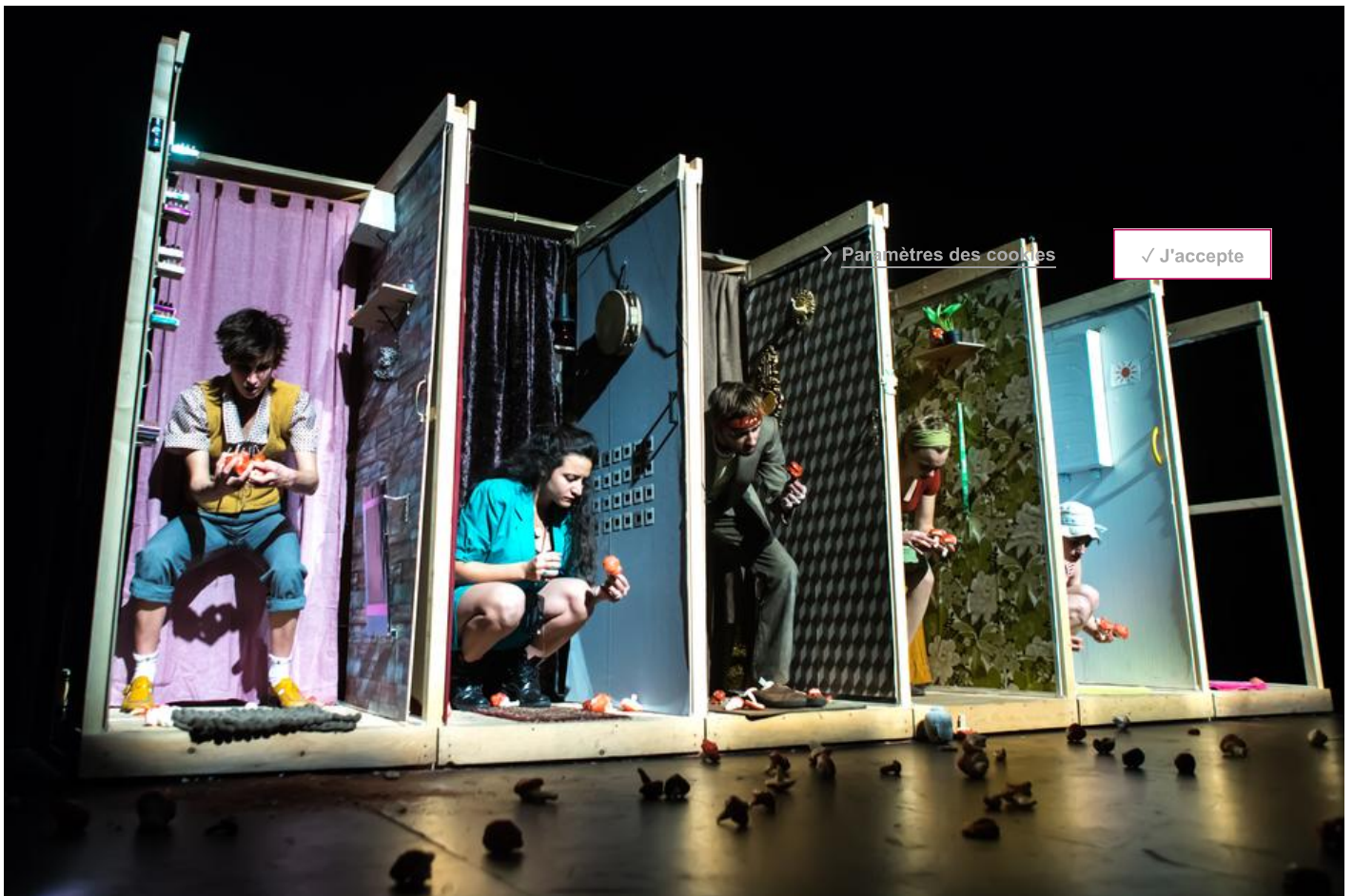
Les voisins dans leurs espaces contigus.